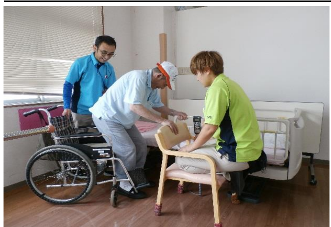
移乗訓練用ベッドで練習する利用者様