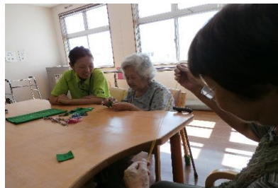
縫物が得意な利用者様

9月より運動スペースの一角に、3台目のベッドが導入されました。移乗練習や起き上がり動作など、日常生活に必要なベッド動作の練習を行っています。練習が行われない時間帯（お昼前後）などは、休憩用ベッドとしても利用していただいています。 また、機能訓練指導員を2名専属配置することにより、個別機能訓練の充実を図っています。レッドコードやマシン運動はもちろん、入浴動作、排泄動作、食事動作、そして移乗動作に至るまで、セラピストの目線で観察・指導・評価させていただきました。