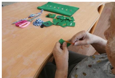
まだまだ技術は衰えていない！